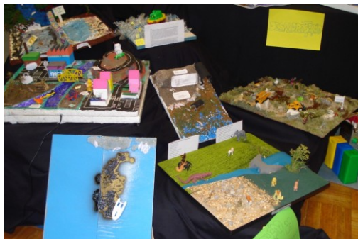
Maquetas elaboradas pelos alunos de 9º ano