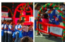
A marcha da República