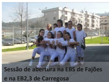
Sessão de abertura na EBS de Fajões e na EB2,3 de Carregosa