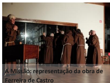
A Missão: representação da obra de Ferreira de Castro