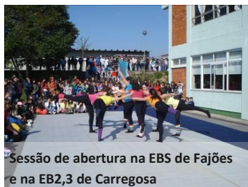
Sessão de abertura na EBS de Fajões e na EB2,3 de Carregosa