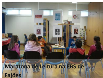
Maratona de Leitura na EBS de Fajões