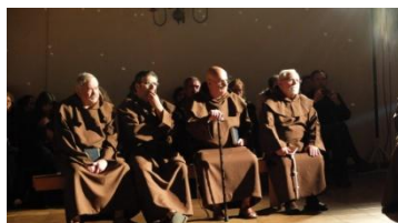
A Missão: representação da obra de Ferreira de Castro

Quem nunca terá tido problemas de consciência? E hesitações? Quem nunca se questionou sobre o caminho a seguir?