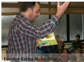
Escritor Carlos Nuno Granja

As atividades desenvolvidas permitiram a multidisciplinaridade, o apoio aos currícula tendo, a Semana da Leitura, que decorreu de 17 a 22 de março, contribuído para a divulgação e a descoberta dos valores literários locais, nem sempre devidamente valorizados.