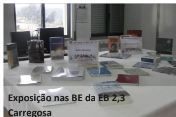
Exposição nas BE da EB 2,3 Carregosa